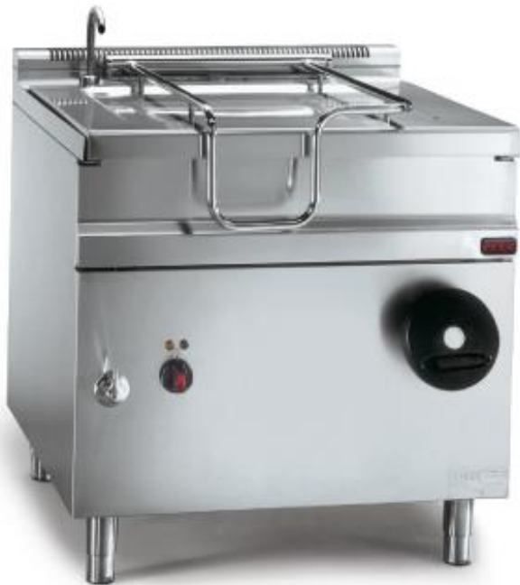
Prekucne ponve Easybrat Firex