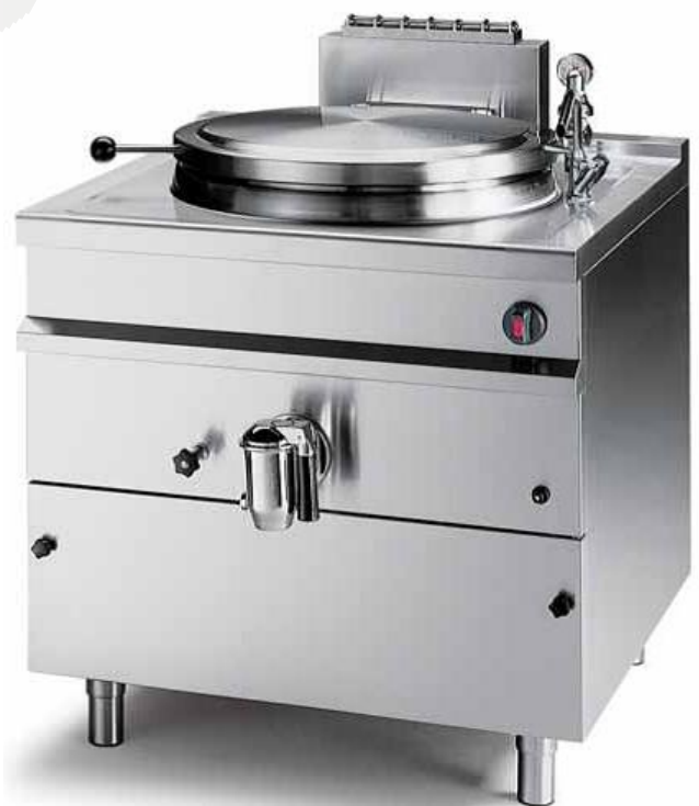
Okrogli kotli Easypan Firex