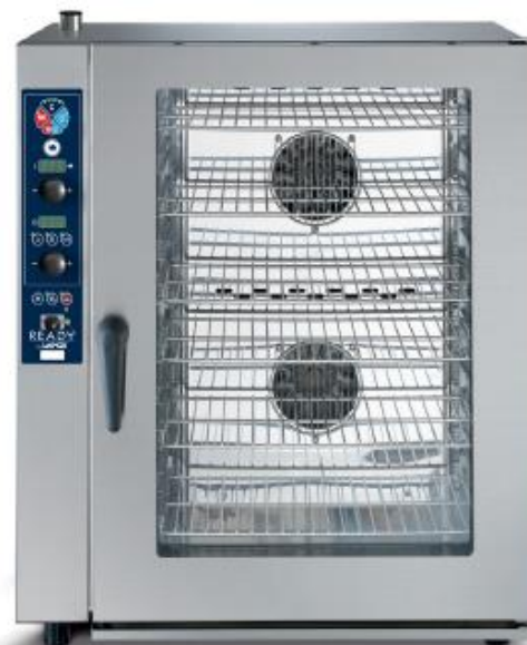
Parnokonvekcijska peč Ready S Lainox

Zelena tehnologija omogoča manjšo porabe elektrike / plina, vode in čistil