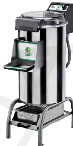
Lupilci krompirja PPN/PPF Fimar

Lupilci krompirja Fimar Abrazivna obloga na disku in steni Kap. 5/10/18/25kg Napetost 230/400V Moč od 370W do 1100W Urna kapaciteta od 60kg/h do 450kg/h Timer do 4 minute