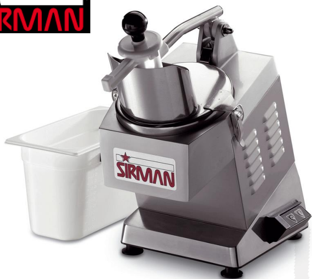
Rezalnik zelenjave TM Sirman