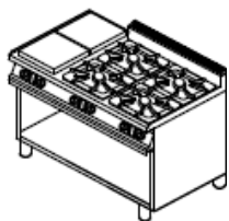
2 elektrika, 4 plin, spodaj odprto

Na razpolago termični elementi linij 600, 700 in 900!