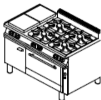
2 elektrika, 4 plin, spodaj pečica (plinska, električna klasična ali električna konvekcijska)