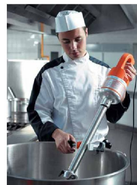
Enostavno in praktično rokovanje

Profesionalni mikserji Dynamic francoskega proizvajalca, so znani po svoji trpežnosti, enostavnem rokovanju in praktičnosti. Komplet Master MFAP 2000 vsebuje pogonski stroj in tri snemljive nastavke (za miksiranje, stepanje in piriranje), ki se lahko preprosto in v le nekaj sekundah zamenjajo. Mikser ima funkcijo neprestanega delovanja, pulznega delovanja in nastavitve zelene hitrosti obratov. Vsi nastavki so iz inoxa in opremljeni z noži, ki so prevlečeni z titanijevo zlitino, kar omogoča daljšo življenjsko dobo in ostrino nožev. Mikser je namenjen miksiranju do 100 litrov mase, 20 litrom mase za stepanje in 30kg kuhanega krompirja za piriranje.