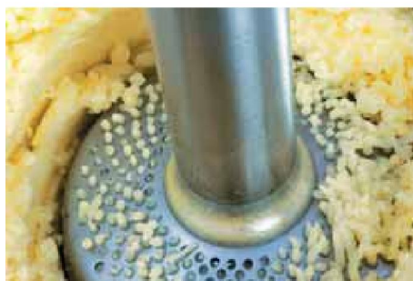
Nastavek za piriranje