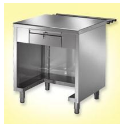
Pult s predalom za blagajno dim. 1000x700xh890mm