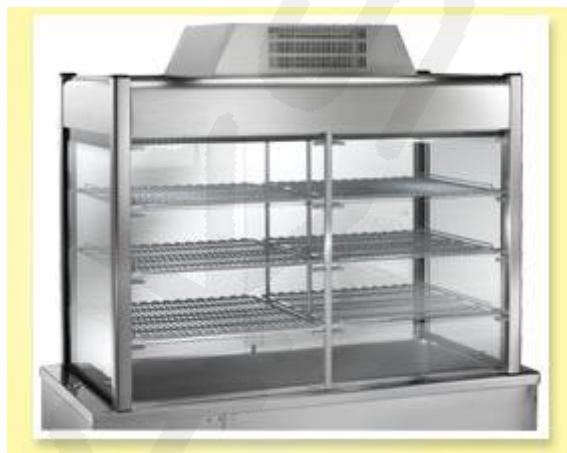
Hlajena vitrina na pultu, 3 police, digitalni termostat, dim. 1500x700xh1260mm