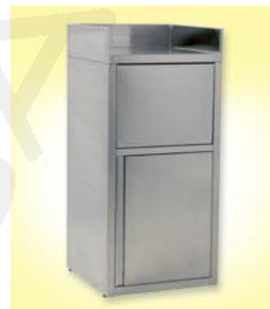
Element za vračanje pladnjev, dim. 600x600xh1200