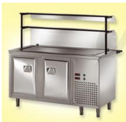
Hlajeni pult s hlajenim bazenom +2-+15°C za 4xGN 1/1 in hlajeno omarico 0-15°C, dim. 1500x700xh1400mm