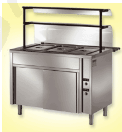
Toplovodna kopal z ogrevano ali nevtralno omarico 0-90°C za 3xGN 1/1 0-90°C, dim. 1200x700xh1400