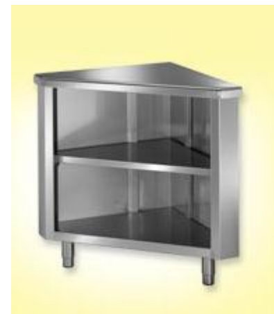
Kotni element 90°, dim. 700x700xh890mm