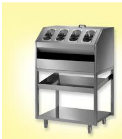
Element za pribor, pladnje in kruh, dim. 1000x700xh1500mm