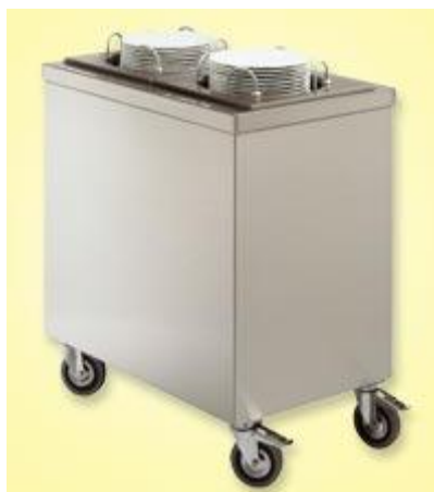
Nevtralni ali ogrevani inox voziček za krožnike premara 190-280mm