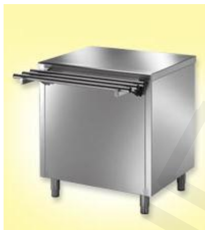
Nevtralni inox element z drsnico, dim. 1000x700xh890mm