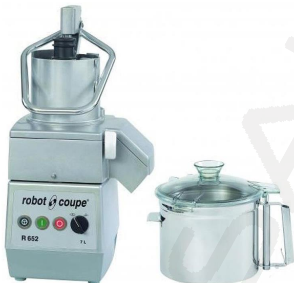
Multifunkcijski aparat R652VV s kapaciteto kotlička 7 litrov in variabilno hitrostjo delovanja.

Namizni multifunkcijski aparati R402, R502 in R652 Robot Coupe združujejo dva aparata v enem. Lahko jih uporabljate kot rezalnik zelenjave ali kot kuter. Na razpolago so številni rezalni diski, ki omogočajo rezanje na trakove, kocke, oblice. Z diski lahko ribate, strgate in režete. Diske si lahko ogledate v priloženi brošuri. S kuterjem pa zelenjavo s pomočjo gladkega ali nazobčanega dvokrakega noža zmiksate. Aparati so dobavljivi z enojno ali variabilno hitrostjo delovanja. Kapaciteta aparata R402 je 4,5 litra (za pripravo do cca. 100 obrokov), R502 je 5,5 litra (za pripravo do cca. 200 obrokov) in R652 je 7 litrov za pripravo več kot cca. 200 obrokov). Serijsko je v kompletu en raven dvokraki nož, brez diskov za rezanje ali ribanje.