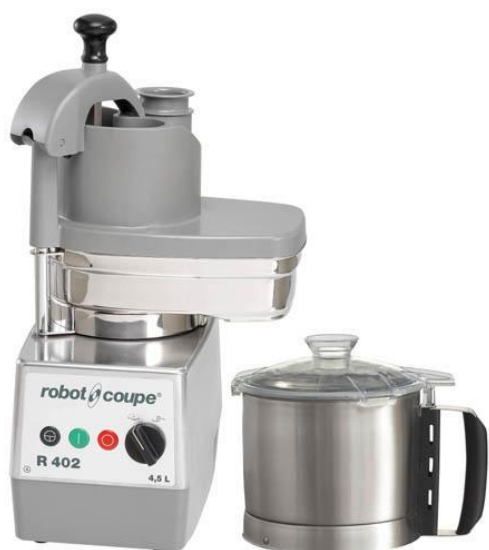
Multifunkcijski aparat R402VV s kapaciteto kotlička 4,5 litra in variabilno hitrostjo delovanja.