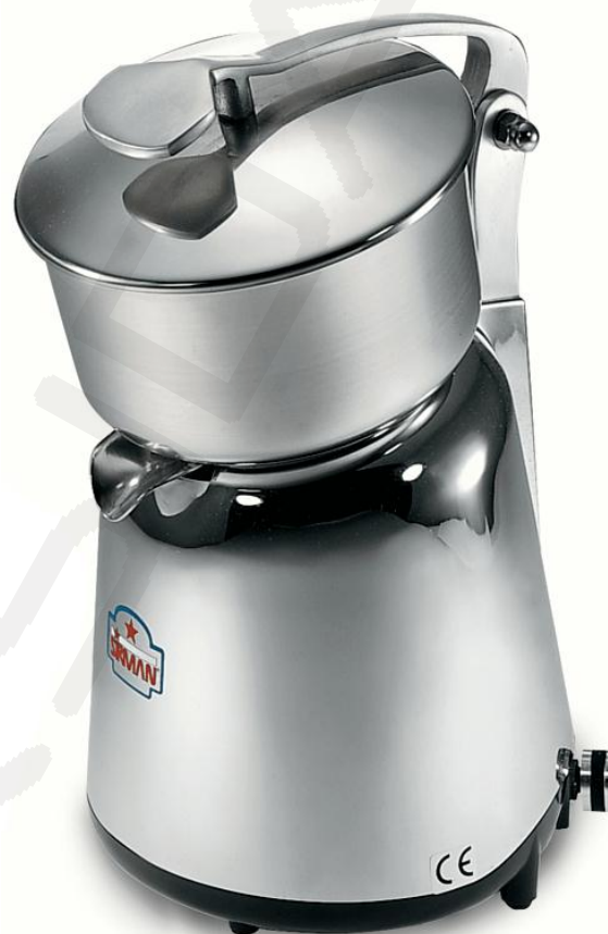
Ožemalec citrusov Apollo leva z nastavljljivo hitrostjo.

Enostavno pomivanje in vzdrževanje tudi v pomivalnem stroju.