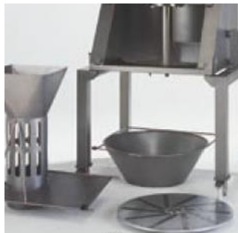
Visoka higiena in enostavno čiščenje

Stroj za izrezovanje sredic pri zeljnih glavah KSB je izredno robusten in primeren za izrezovanje sredic različnih velikosti zeljnih glav, saj ima nastavljivi hod globine noža. Max. premer zeljne glave, ki se še lahko obdeluje na stroju je 260mm. Aparat je varen za rokovanje, saj uporabnik ob pravilnem rokovanju ne more priti v stik z nožem. Kapaciteta izrezovanja je cca. 600 zeljnih glav na uro. Stroj je izdelan iz Inoxa. Globina izrezovanja sredice kot tudi diameter držala zelja se lahko prilagodijo glede na velikost zeljnate glave z uporabo dveh vzvodov oziroma ročic.. Oba aparata sta plod nemškega znanja in kvalitete.