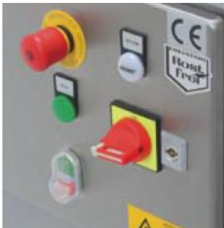
Varno in enostavno rokovanje