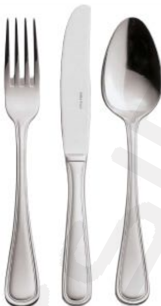
Jedilni pribor Contour