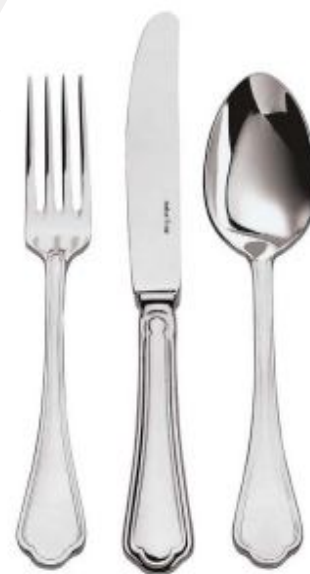
Jedilni pribor Versailles