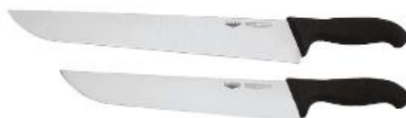
Mesarski nož od 18 do 36cm (180002)