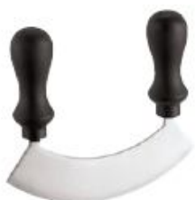
Nož za sekljanje od 16 do 26cm (48017)