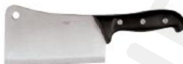
Nož za ločevanje mesa 18cm (18220)