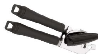
Odpirач za pločevinke (48280)

Preverite našo ostalo ponudbo na internetni strani: www.saksida-inox.si