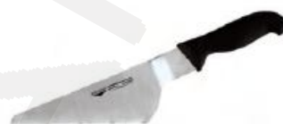
Nož za lasagno 16cm(18216)