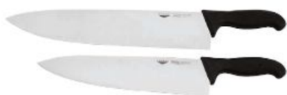
Kuhinjski nož od 16 do 36cm (18000)