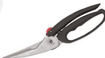
Škarje za perutnino 25cm (18263)