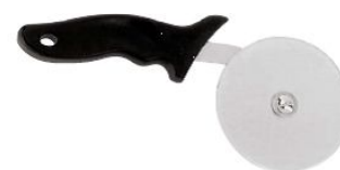
Nož za pizzo (18324)