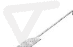
Lopatica perforirana (11976)