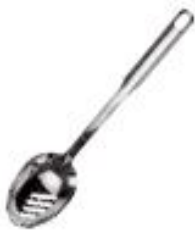
Žlica perforirana (41676)