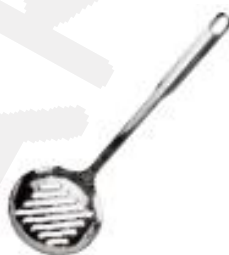
Lopatica okrogla perforirana (41671)