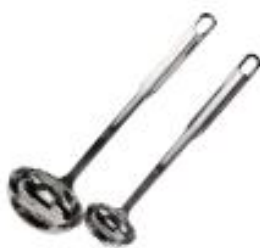
Zajemalka podolgovata (41670)