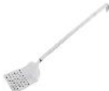
Lopatica perforirana (11973)