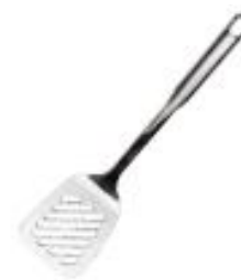
Lopatica perforirana (41672)