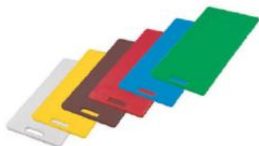
GN pladnji različnih barv (42541)