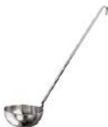
Zajemalka mala (11970)