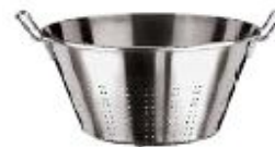
Perforirana posoda za zelenjavo (11930)