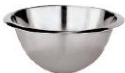
Skleda za stepanje (11957)