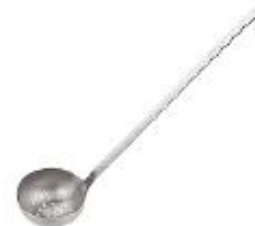
Zajemalka perforirana (11976)