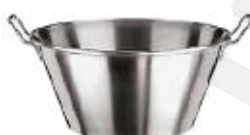
Posoda za zelenjavo (11955)