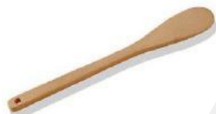
Lesena žlica podolgovata (42907)