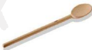
Lesena žlica okrogla (42901)