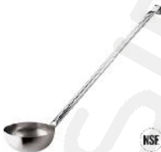
Zajemalka velika (11968)