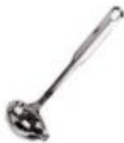
Zajemalka za omake (41677)