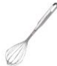
Metlica za stepanje (41678)