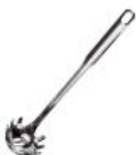
Zajemalka za špagete (41673)