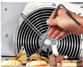
Sonda za preverjanje središčne temperature živila