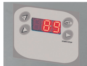
Elektronski displej in stikala

Šok sistem Lampo Dim: 610x630xh395mm Hlajenje: +70 do +3°C, 8kg v 90min Zmrzovanje: +70 do -18°C, 5kg v 240min Volumen: 29 lit. Št. pladnjev: 3x 2/3 GN Napetost: 230V Moč: 680W