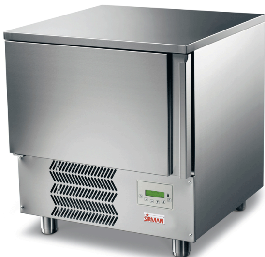
Model Cervino 5T Gelateria