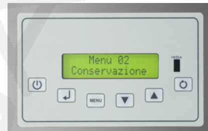
Elektronski displej in stikala

Šok sistem Cervino 5T Gelateria Dim: 740x750xh830mm Hlajenje: +70 do +3°C, 12kg v 90min Zmrzovanje: +70 do -18°C, 9kg v 240min Volumen: 92 lit. Št. pladnjev: 5x 1 GN Napetost: 230V Moč: 1,39kW