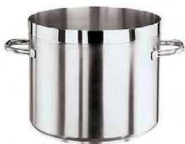
Lonci od 2,7lit. do 40lit. (11105)