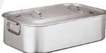
Pekači globoki od 40x26cm do 60x35cm (16965)