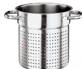
Perforirani lonci (11123)