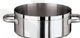
Lonci od 1,3lit. do 37lit. (11109)