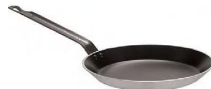
Ponve plitke Ø od 22cm do 30cm (16712)