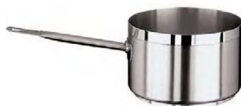
Kozice glokoke od 1,2lit. do 22lit. (11108)