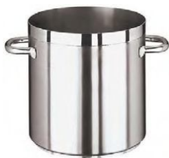
Lonci od 3,2lit. do 100lit. (11101)