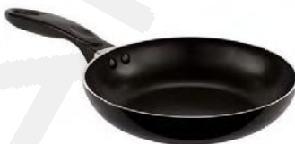
Ponve globoke Ø od 18cm do 32cm (41720)