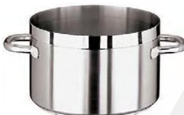
Lonci od 2,1lit. do 63lit. (11107)