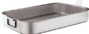
Pekači plitki od 40x26cm do 61x43cm (16941)