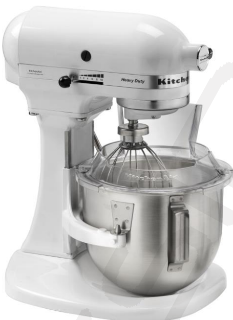
Pogonski stroj K5 s 5lit. kotličkom