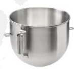
Inox kotliček 5lit.