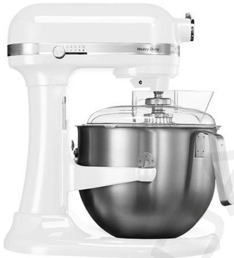
Pogonski stroj K7 s 6,7lit. kotličkom