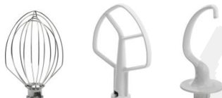
Metlica, lopatica in spirala