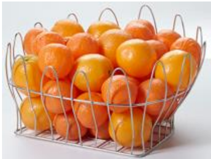
Opcijska košara za pomaranče