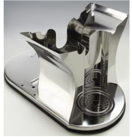
Opcijski podstavek za aparat