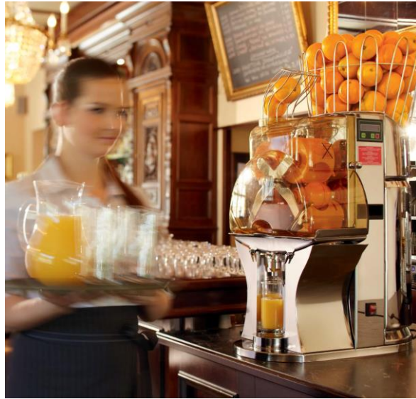
Kompaktnost in estetika