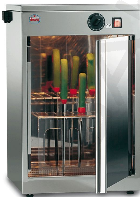
Model UV Sterilizzatore 24W

Model desno: UV Sterilizzatore 24W dim:400x300xh620mm sterilizacija z UV žarnicami kapaciteta nožav: 20 moč: 8W napetost: 230V50Hz1N št. UV žarnic: 3 timer: 0-120min teža: 14,5kg