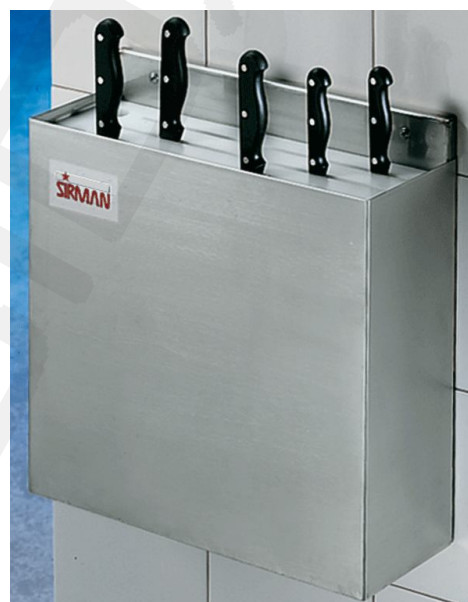
Model Liquido sterilizzatore

Model levo: Liquido sterilizzatore dim:400x135xh35+360mm sterilizacija s pomočjo tekočine max.dolžina rezila: 320mm teža: 5kg