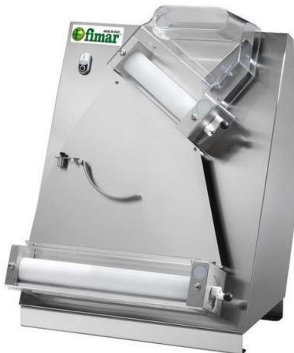
Aparat za rolanje pica testa z dvema valjema FI/42N Fimar