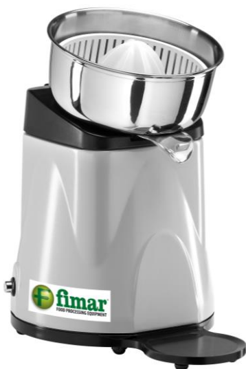
Ožemalec citrusov SPM brez pokrova

Ožemalec citrusov SPM in SPL Model z ali brez pokrova Snemljiva inox posoda Enostavno čiščenje Dim. 210x305xh330/365mm Napetost 230V Moč 210W Hitrost obratov 500rpm Teža 3,8kg / 4,5kg