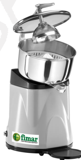
Ožemalec citrusov SPL s pokrovom

Ožemalec citrusov SPM in SPL Model z ali brez pokrova Snemljiva inox posoda Enostavno čiščenje Dim. 210x305xh330/365mm Napetost 230V Moč 210W Hitrost obratov 500rpm Teža 3,8kg / 4,5kg