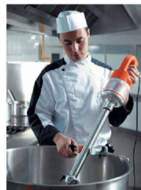
Enostavno in praktično rokovanje

Profesionalni mikserji Dynamic francoskega proizvajalca, so znani po svoji trpežnosti, enostavnem rokovanju in praktičnosti. Komplet Master MFAP 2000 vsebuje pogonski stroj in tri snemljive nastavke (za miksanje, stepanje in piriranje), ki se lahko preprosto in v le nekaj sekundah zamenjajo. Mikser ima funkcijo neprestanega delovanja, pulznega delovanja in nastavitve zelene hitrosti obratov. Vsi nastavki so iz inoxa in opremljeni z noži, ki so prevlečeni z titanijevo zlitino, kar omogoča daljšo življenjsko dobo in ostrino nožev. Mikser je namenjen miksanju do 100 litrov mase, 20 litrom mase za stepanje in 30kg kuhanega krompirja za piriranje.