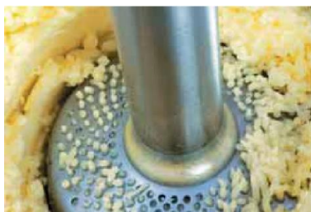
Nastavek za piriranje