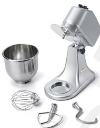
Enostavna demontaža in čiščenje V kompletu tri metlice in 7 lit. Inox kotliček