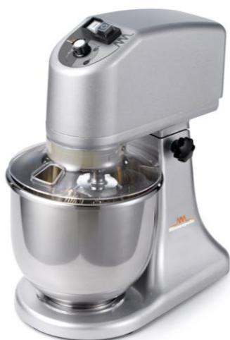
Model Plutone 7 namizni