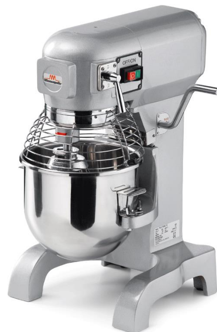
Model Plutone LT 10 in LT 20 prostostoječ

Enostavna demontaža in čiščenje, v kompletu tri metlice in 10 oziroma 20 litrski Inox kotliček.